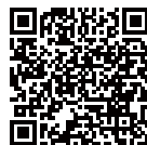
高鐵接駁車時刻表